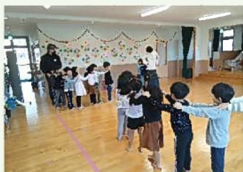
じゃんけん列車の様子です

と、大変うれしいお言葉をいただきました。保護者の皆さま、ありがとうございました。Instagram、Facebookでも紹介しています。そちらもどうぞご覧ください。