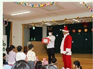
「お手紙がついてたよ」