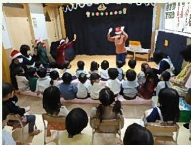
オープニングセレモニーです