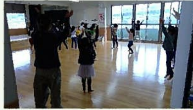
一緒に体操しています