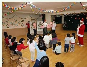
「ぶれぜんとがあったよ！」