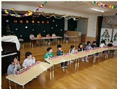
♪きらきらぼし♪演奏中です

みんなでクリスマスソングを歌った後、クラスごとで作った一人一人の飾りを司会が紹介していると、突然鈴の音がどこからか聞こえてきて、屋上から「どすん」と音がしました。慌てて本庄保育教諭が屋上へ行ってみると、プレゼントと手紙が置かれていたそうです。中身を開けてみると、みんなで遊べるプレゼントで、大喜びの子どもたちでした。