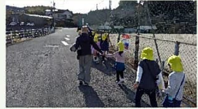
園に帰っているところです