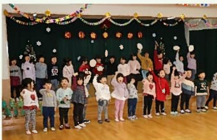
♪さよならシャランラン♪