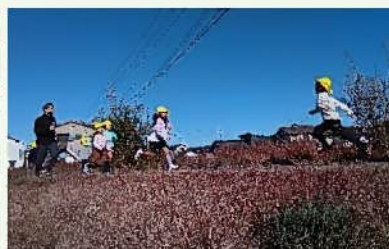
マラソン、2往復目です