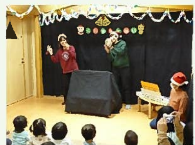
♪あわてんぼうのサンタクロース♪