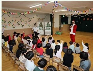
「プレゼント、発表できる人いるかな？」