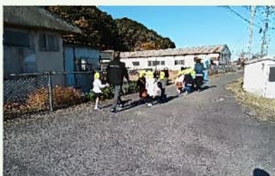
河原沿いをお散歩です