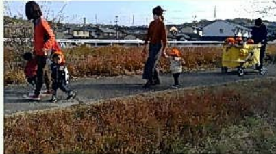
ゆっくりとお散歩です