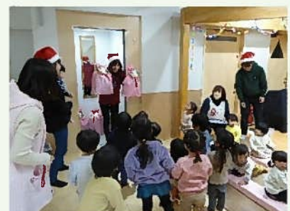
「プレゼントがあったよ～」