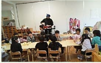
ご飯をつぎ分けています