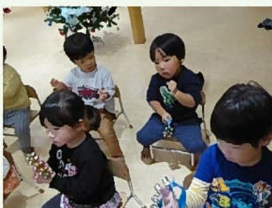
「いそいでりんりんりん♪」