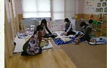
お昼寝の援助をしています