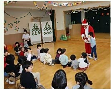
「まだ、きめていません」