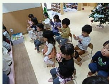
「お、なにかはじまった?!」