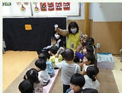
「あいたたどんどんどん♪」