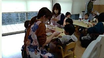
食事の援助をしています