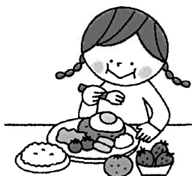
しっかり食べて栄養をとる (ビタミンCがおススメ)