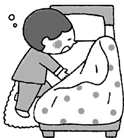
とにかく休む (あたたかくして早寝しよう)